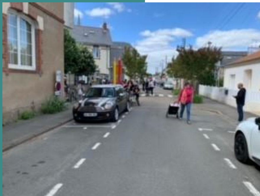
Rue du 8 mai 1945 Groupe scolaire du Centre