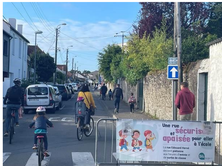
Rue Edouard Hervé Groupe scolaire du Douet