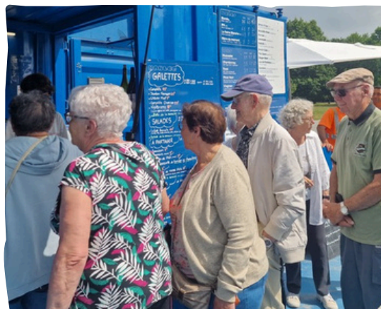
Pique nique estival