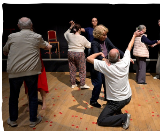
Danse Partagée (Compagnie NGC25) Semaine Bleue 2025