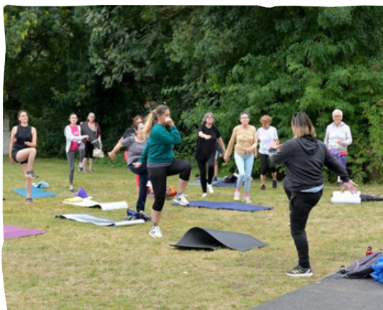
La Loire Cool - Sport à la fraîche