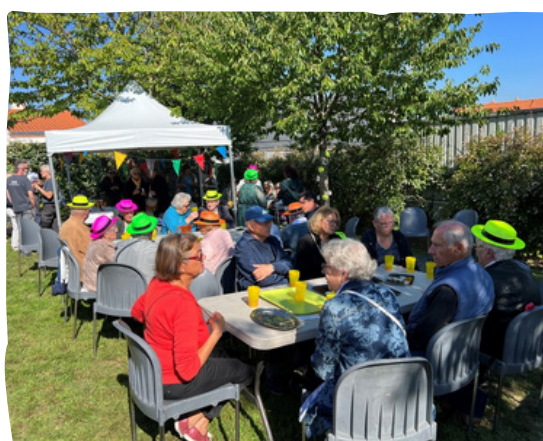
Inauguration du Jardin Intergénérationnel "La Pépîte Verte"