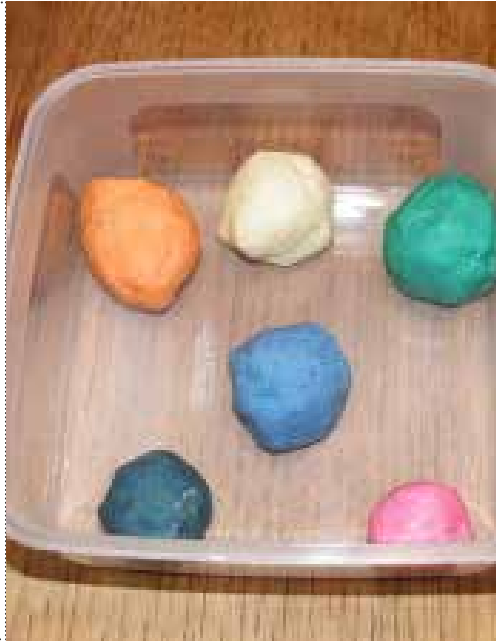
Conception : Freemove - Impression sur papier recyclé, août 2019 - Crédits photos/illustrations : ©Cetty - ©Shutterstock - ©Freepik